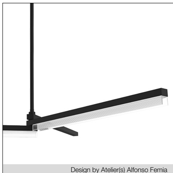
Design by Atelier(s) Alfonso Femia