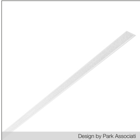
Design by Park Associati