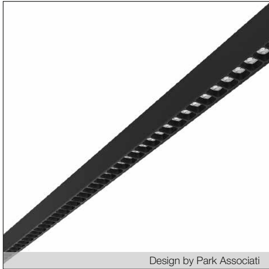
Design by Park Associati