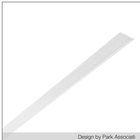
Design by Park Associati