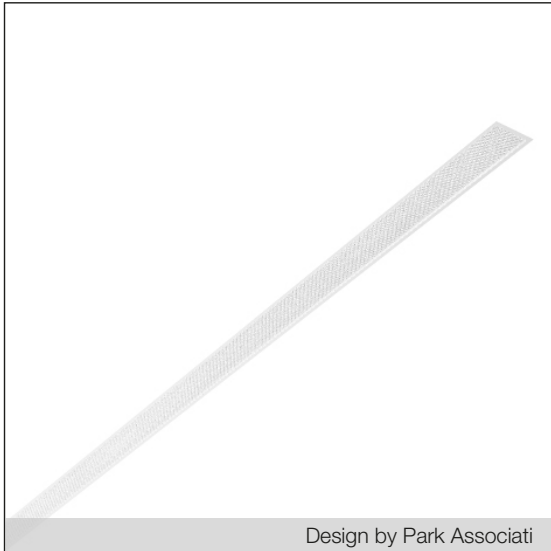
Design by Park Associati