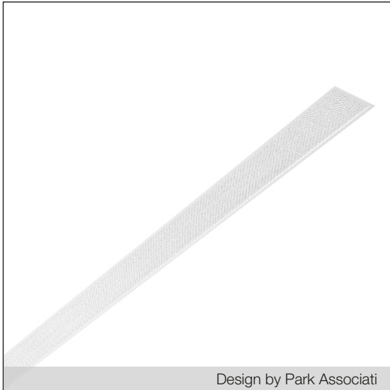
Design by Park Associati