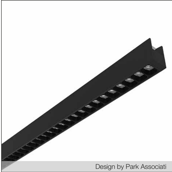
Design by Park Associati