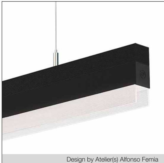
Design by Atelier(s) Alfonso Femia