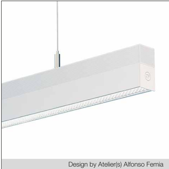
Design by Atelier(s) Alfonso Femia