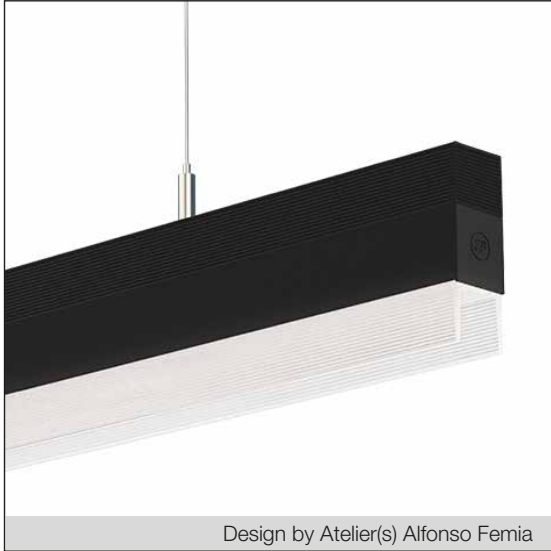
Design by Atelier(s) Alfonso Femia