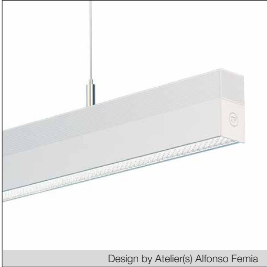
Design by Atelier(s) Alfonso Femia