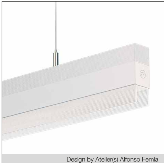
Design by Atelier(s) Alfonso Femia