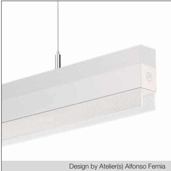
Design by Atelier(s) Alfonso Femia