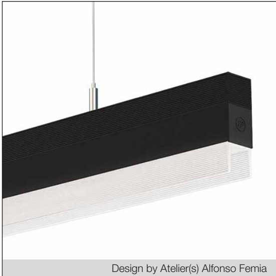
Design by Atelier(s) Alfonso Femia