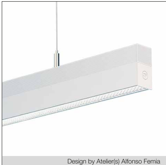
Design by Atelier(s) Alfonso Femia