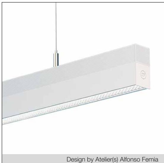
Design by Atelier(s) Alfonso Femia