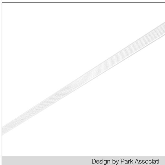
Design by Park Associati