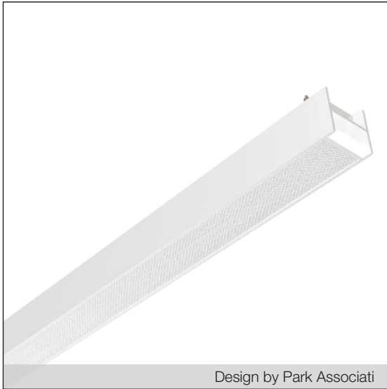
Design by Park Associati