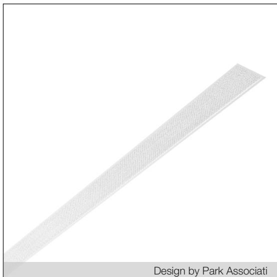
Design by Park Associati