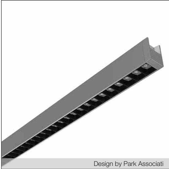
Design by Park Associati