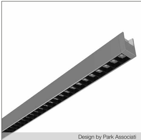
Design by Park Associati