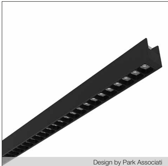
Design by Park Associati