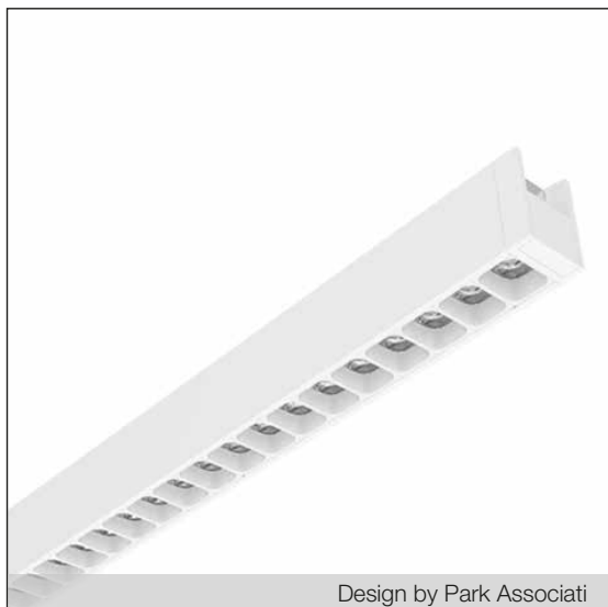
Design by Park Associati