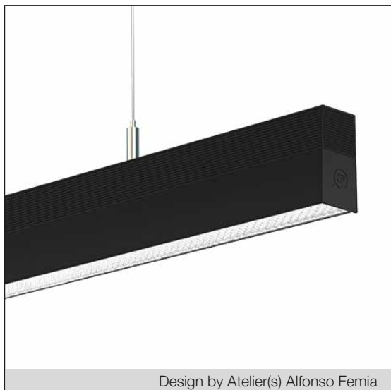
Design by Atelier(s) Alfonso Femia