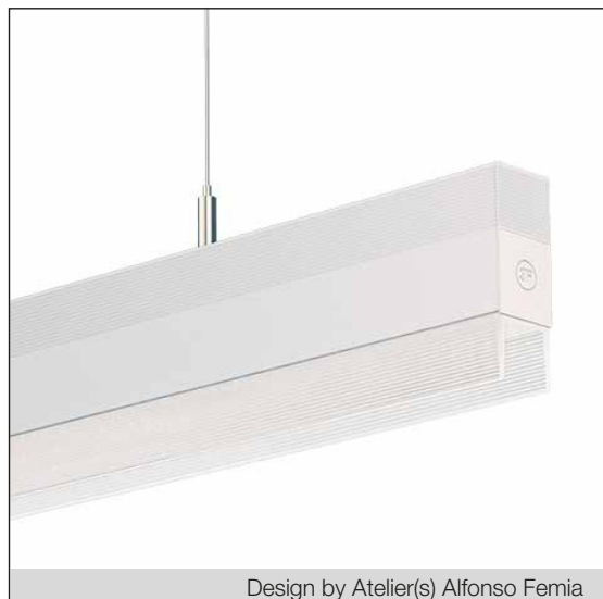
Design by Atelier(s) Alfonso Femia