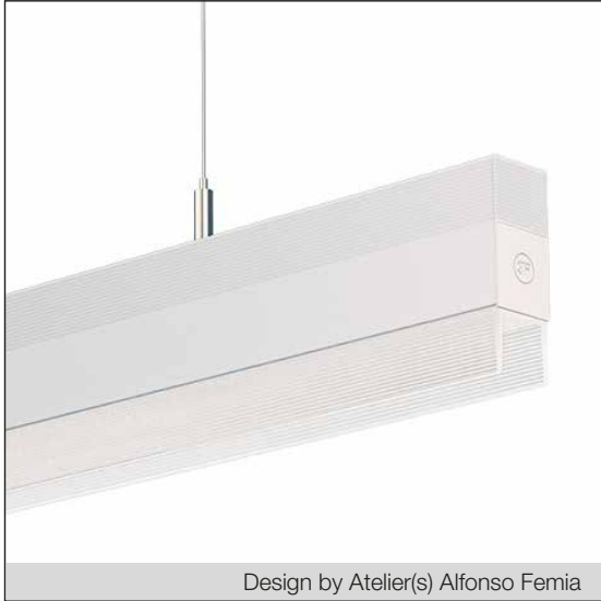
Design by Atelier(s) Alfonso Femia