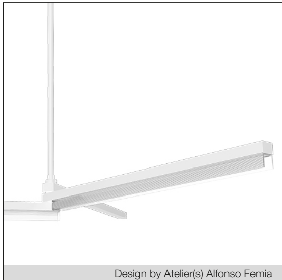
Design by Atelier(s) Alfonso Femia