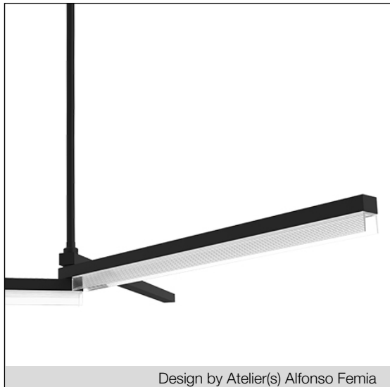
Design by Atelier(s) Alfonso Femia